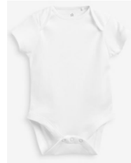
מארז בגדי גוף עם שרוול קצר 7-10 יחידות