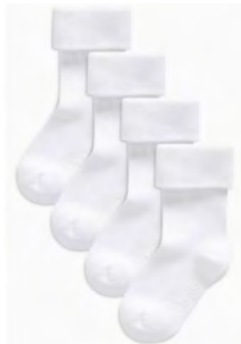
גרביים 6 זוגות