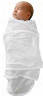
עיטוף 1 יחידה