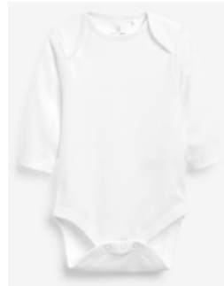
מארז בגדי גוף עם שרוול ארוך 5-10 יחידות