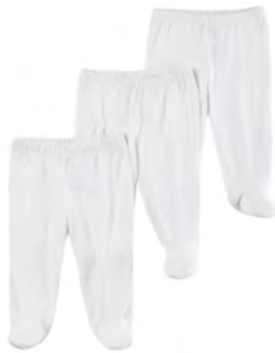
מכנסיים עם רגלית 7-10 יחידות