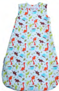
שק שינה 1 יחידה