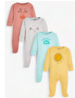
אוברולים עם רגליות 5-10 יחידות