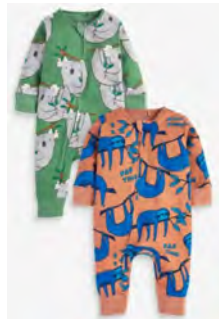
אוברולים ללא רגלית 4-5 יחידות